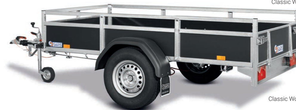
Classic Wood BMG135