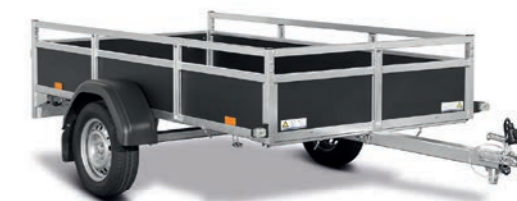
Classic Wood AMG75