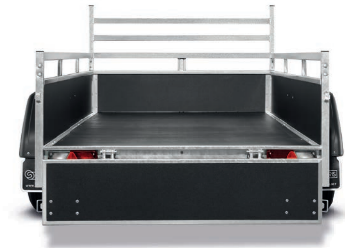
Classic Wood ASF75

* Consultez les conditions de l'opération sur www.saris.net